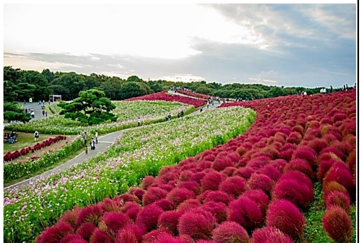
国営ひたち海浜公園 みはらしの丘

日本は四季のある国です。世界中で異常気象が報告されていますが、いつか紅葉も見られない、そんな事にならないことを切に願います。